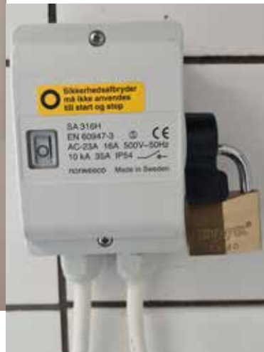
Her eksempler med aflåst forsyningsafbryder.